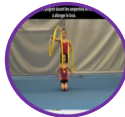
Activités Gymniques d'Expression