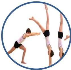
Activités Gymniques Acrobatiques