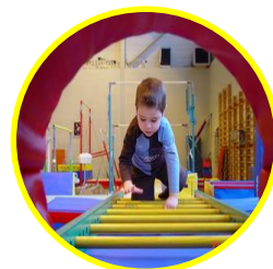
Activités d'Eveil Gymnique pour la Petite Enfance